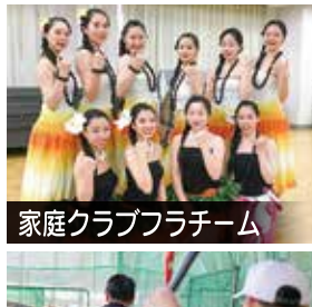
家庭クラブフラチーム