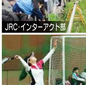
JRC・インターアクト部