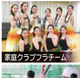
家庭クラブフラチーム